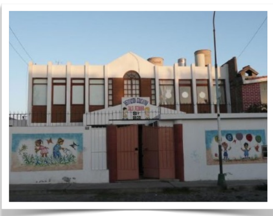
Façade de l'établissement LARA à son ouverture

Le projet de construction est lancé et les travaux vont suivre rapidement.